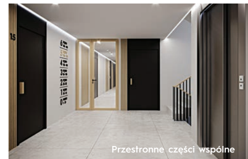
Przestronne części wspólne