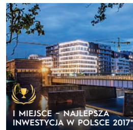
BULWARY KSIĄŻĘCE WROCLAW · 2020