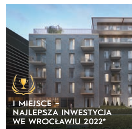
CZYSTA 4 WROCLAW