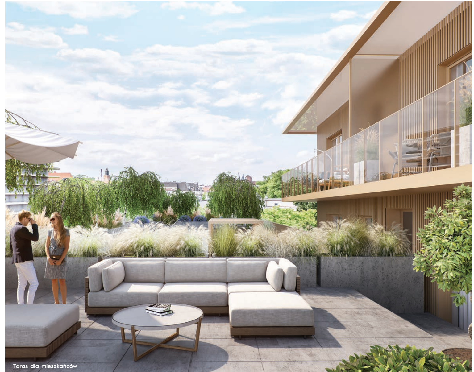
Taras dla mieszkańców