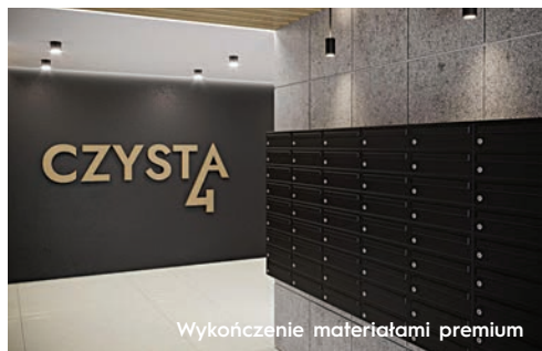
Wykończenie materiałami premium