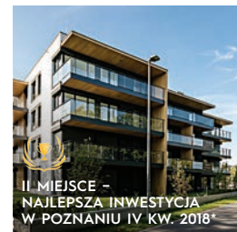
VILDA PARK POZNAŃ · 2020