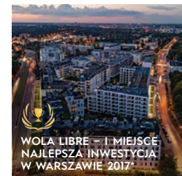
WOLA TARASY WOLA LIBRE WOLARE WARSZAWA · 2014-2020