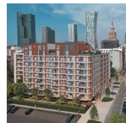
CHMIELNA DUO WARSZAWA

*w rankingu użytkowników portalu rynekpierwotny.pl